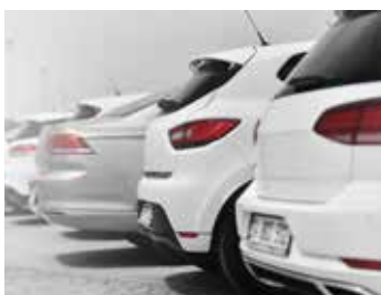
Gestion de flotte automobile