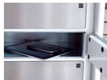
Gestion des équipements de travail

Une des solutions présentées vous intéresse ou vous avez des questions?